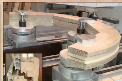
Finestre ad arco - oblò