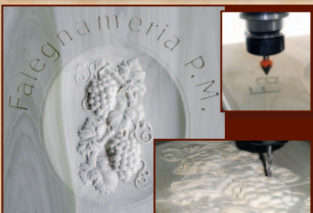
Incisioni di precisione